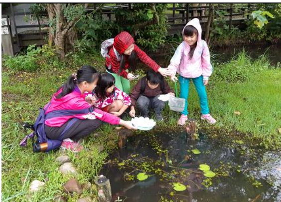
關渡自然公園的體驗活動