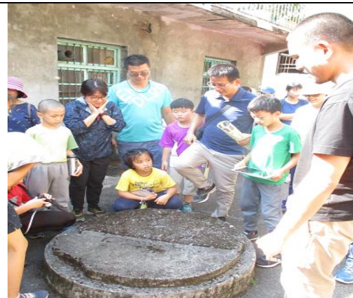
辦理社區踏查研習