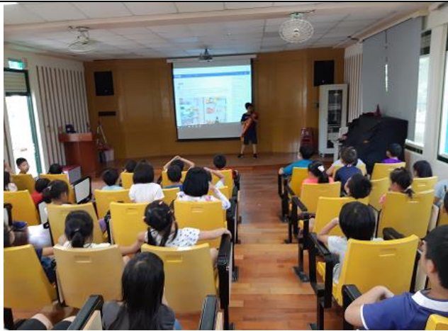
環保小局長作節電宣導