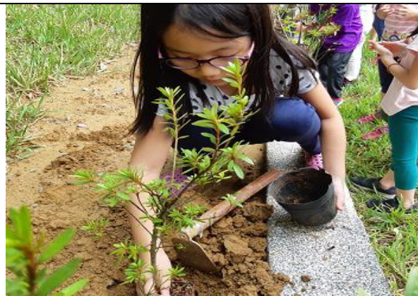
二年級的孩子們很認真地種杜鵑