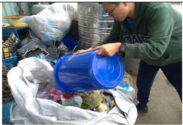
108 年度獲得廢電池評比第一名