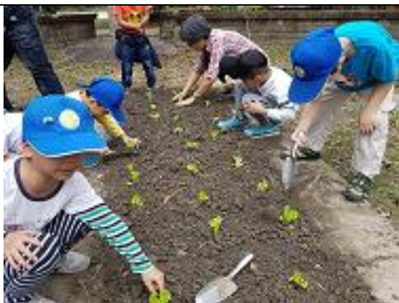
帶領班級學生經營班級蔬菜區