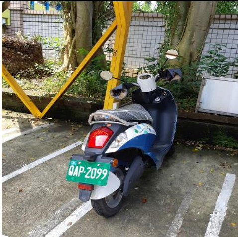
鼓勵騎乘電動機車