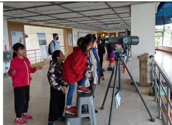
關渡自然公園的觀察鳥類活動