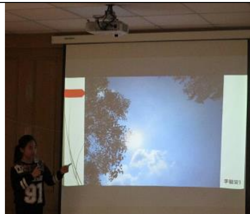
用相機看世界~學生攝影課程