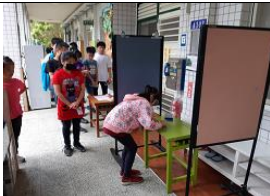
大來投票~選環保小局長