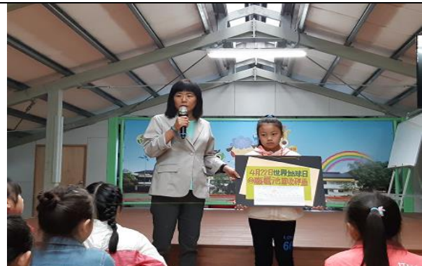
學生朝會宣導費電池對環境的危害