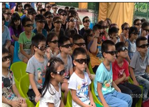
每位學生都很專注的看著