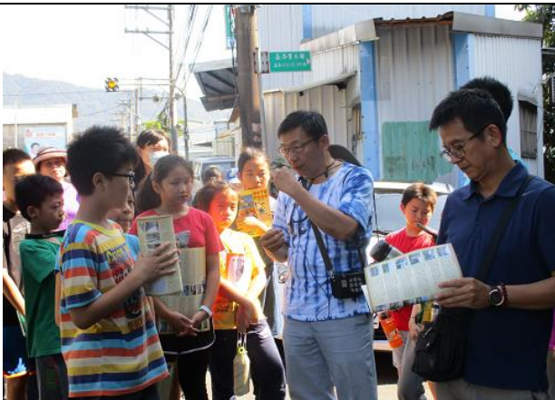
辦理社區踏查研習