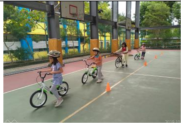
先教導孩子學會牽車再學會騎車