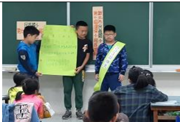
環保小局長選舉活動