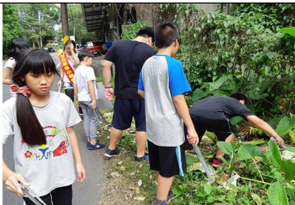
大家都很努力為環境整潔盡一分力