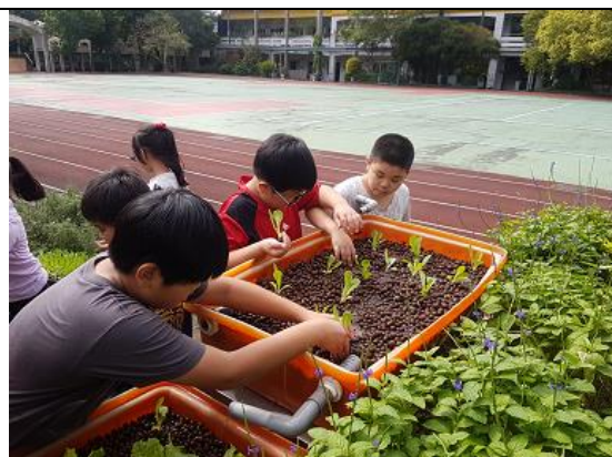
四年級負責學校的魚菜共生種植