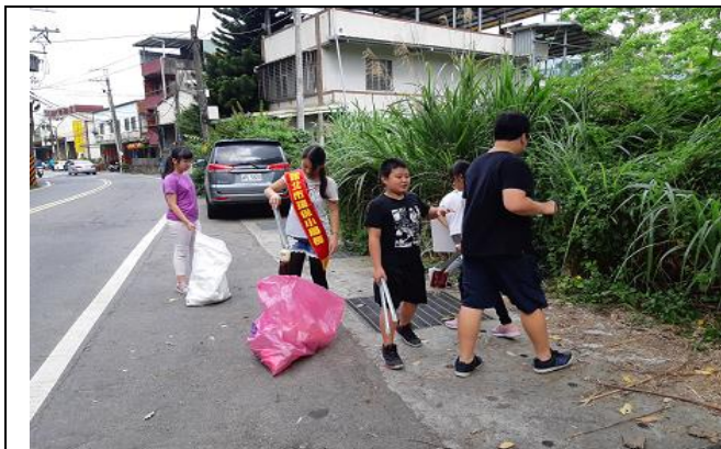
環保小局長帶領六年級同學去淨山