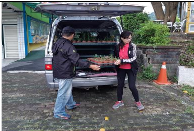
八里焚化廠贈送百合植栽