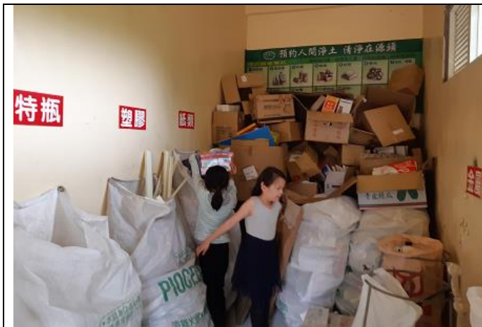
每個班級都能落實資源回收