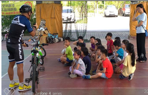
聘請專業教練指導