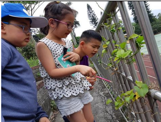
學生在實際觀察下更顯得有興趣