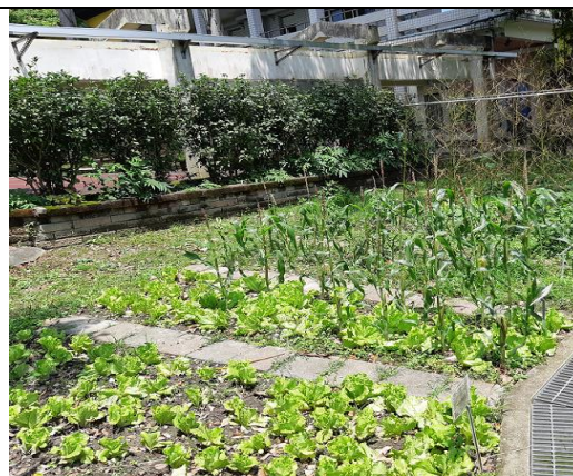
各班種有不同蔬菜