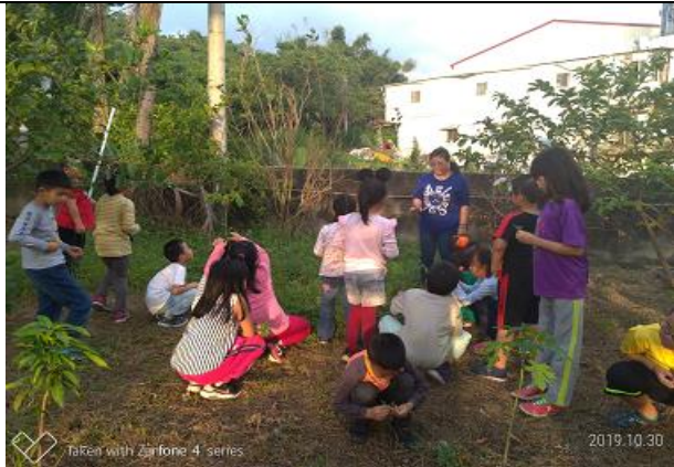
認識校園植物與採摘