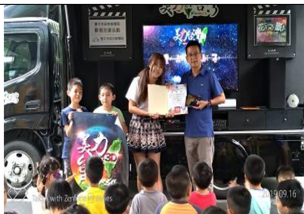
美麗台灣 3D 電影車到校演出