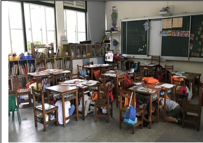
防災演練~就地掩蔽