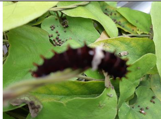
營造環境有利老師教學