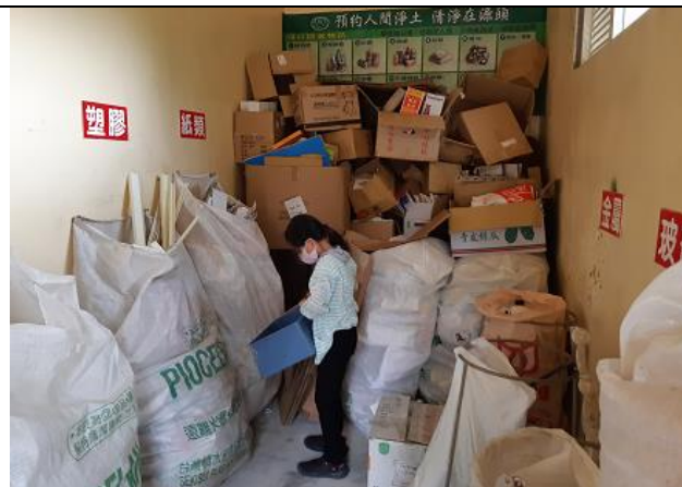
分類好拿到資源回收室