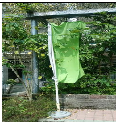
校內的空汙幟您注意到了嗎？