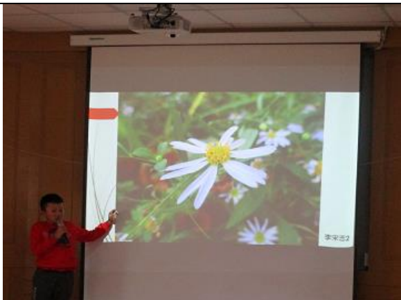
用相機看世界~學生攝影課程