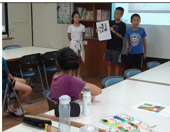
孩子們發表自己的看法