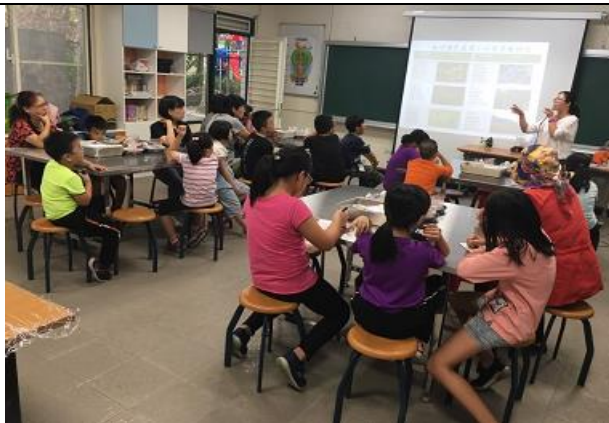
親子 DIY 教學