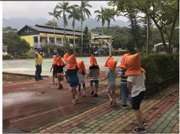
防災演練~疏散到空曠地方