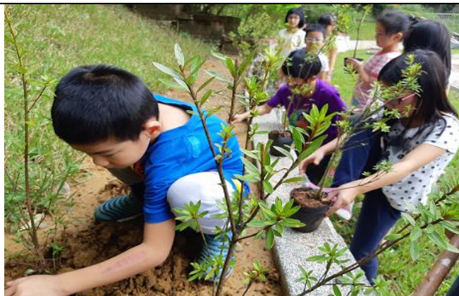
配合新北市政策「打造萬金黃金鄉」