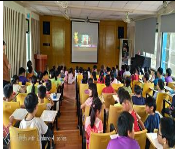
能源教育全校宣導