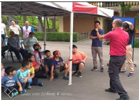
參加榮民之家地震車體驗與指導