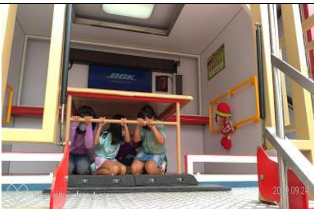
小朋友實際上去地震車體驗