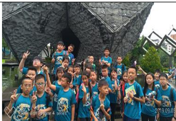
本校由高年級的孩子們參加