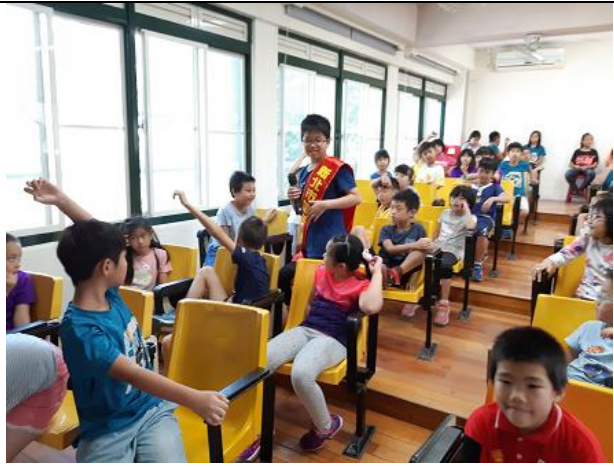
環保小局長與同學問答互動